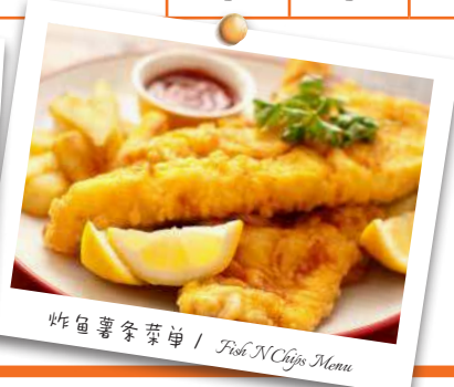
炸鱼薯条菜单 / Fish N Chips Menu