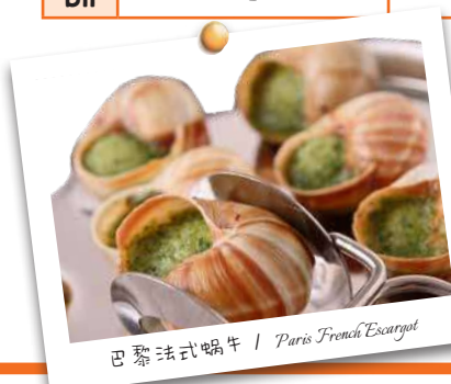
巴黎法式蜗牛 / Paris French Escargot