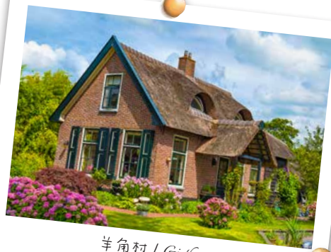
羊角村 / Giethoorn

您可以在这里找到110多个时尚和生活方式品牌，从世界领先的设计师到更实惠的时装。