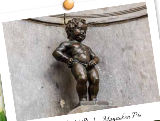
撒尿小童雕像 / Manneken Pis

凯肯霍夫花园 (库肯霍夫郁金香花季从3月中旬-5月初) Keukenhof Flower Garden (Keukenhof season from Mid March - Early May)