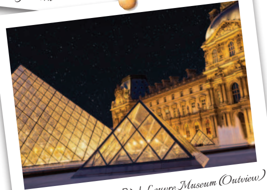
卢浮宫博物馆 (外观) / Louvre Museum (Outview)