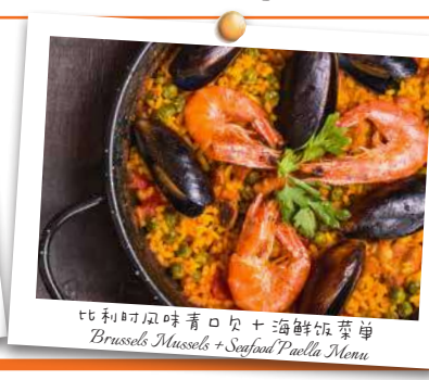
比利时风味青口贝 + 海鲜饭菜单 Brussels Mussels + Seafood Paella Menu